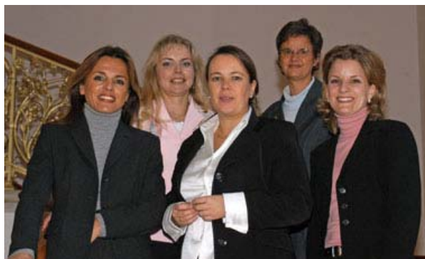
Der Vorstand der Gruppe der Frauen der CDU/CSU-Bundestagsfraktion: v. l. Michaela Noll, Veronika Bellmann, Ursula Heinen, Dr. Eva Möllring, Daniela Raab